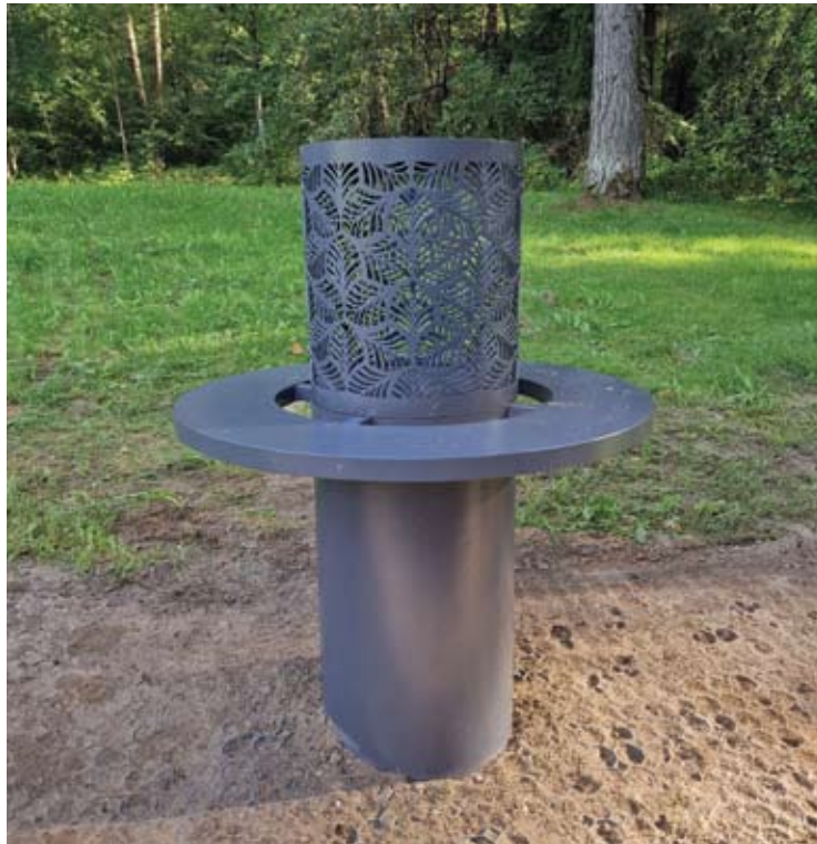
Ant šių pagrindų bus montuojami neįgaliesiems skirti taktiliniai ženklai.

Skirtingose Anykščių vietose pristatyta metalinių konstrukcijų, primenančių aukurus, o gal šiukšliadėžes. Kūriniai dar nėra baigti, įrengti tik pagrindai, ant kurių bus montuojami taktiliniai maketai.