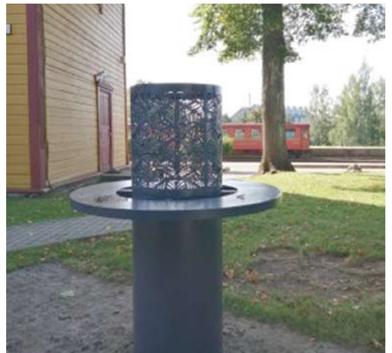
Taktiliniai maketai bus įrengti prie devynių lankytinų objektų Anykščiuose.

Anykščių miesto taktiliniai ženklai – bendro Anykščių, Molėtų ir Zarasų rajonų savivaldybių projekto dalis. Už 340 tūkst. eurų